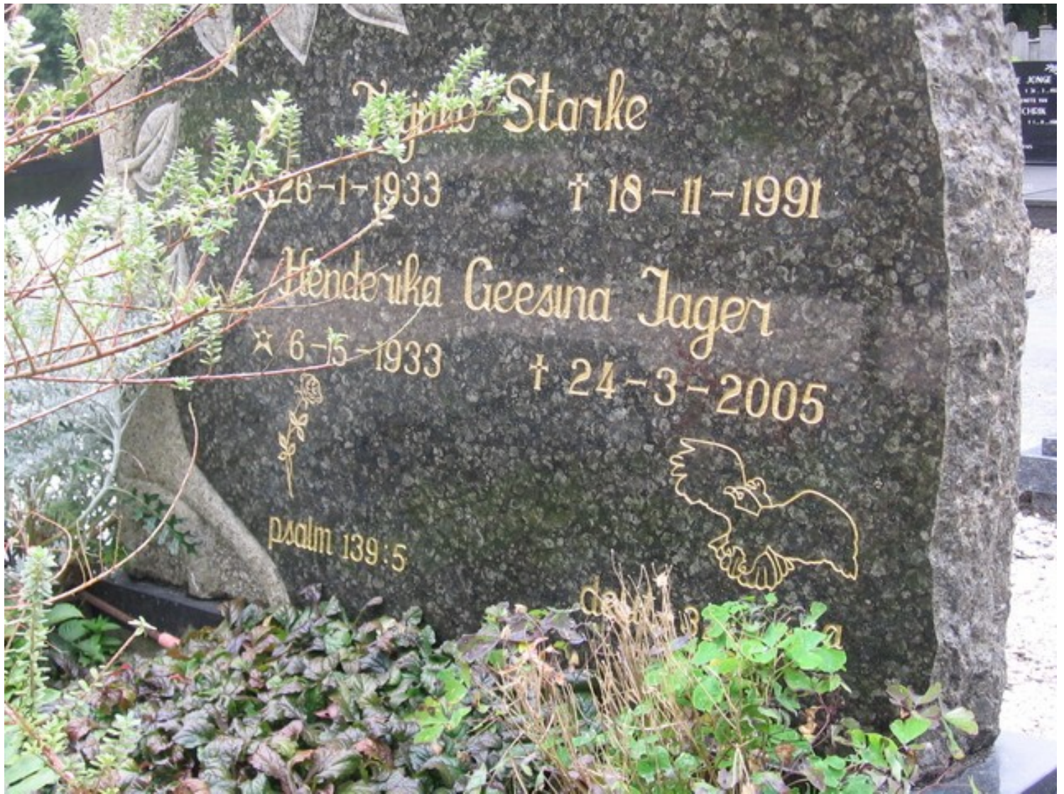
Nieuwe Pekela, Hervormde Begraafplaats